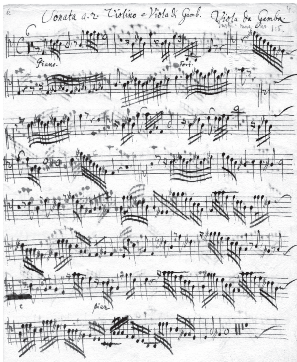
První strana gambového partu Sonáty a 2 Antonia Bertaliho

Sonata a 2 Violino et Viola di Gamba cum Basso pro Organo Di Sign: Anthonio Bertali je nápis na titulní straně rukopisu výjimečné sonáty, která nešetří brilantními, ba až bizarními pasážemi a motivy. Její opis se dochoval v archivu uppsalské univerzity. Pochází ze sbírky švédského skladatele a varhaníka Gustava Dübena, která obnáší 2300 hudebních rukopisů a kolem 150 tisků.