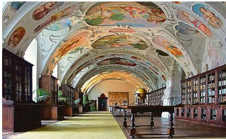
Náměšť nad Oslavou V zámecké knihovně vystoupí 13. června cembalista Benjamin Alard a 23. června smyčcový Protean Quartet.