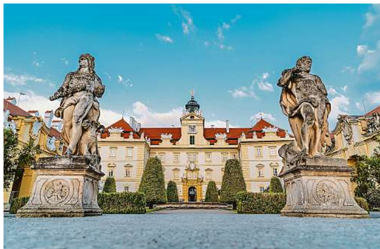
Valtice V neděli 4. června se zámecká kaple naplní lahodnou renesanční vokální polyfonií v podání vlámského souboru Dionysos Now!

Změna programu, účinkujících a míst konání vyhrazena