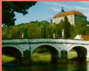
Náměšť nad Oslavou