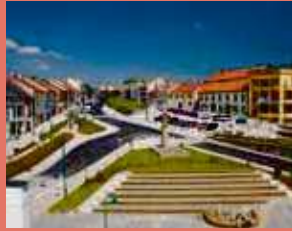
Bystřice nad Pernštejnem