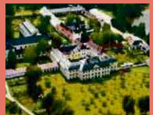
Žďár nad Sázavou