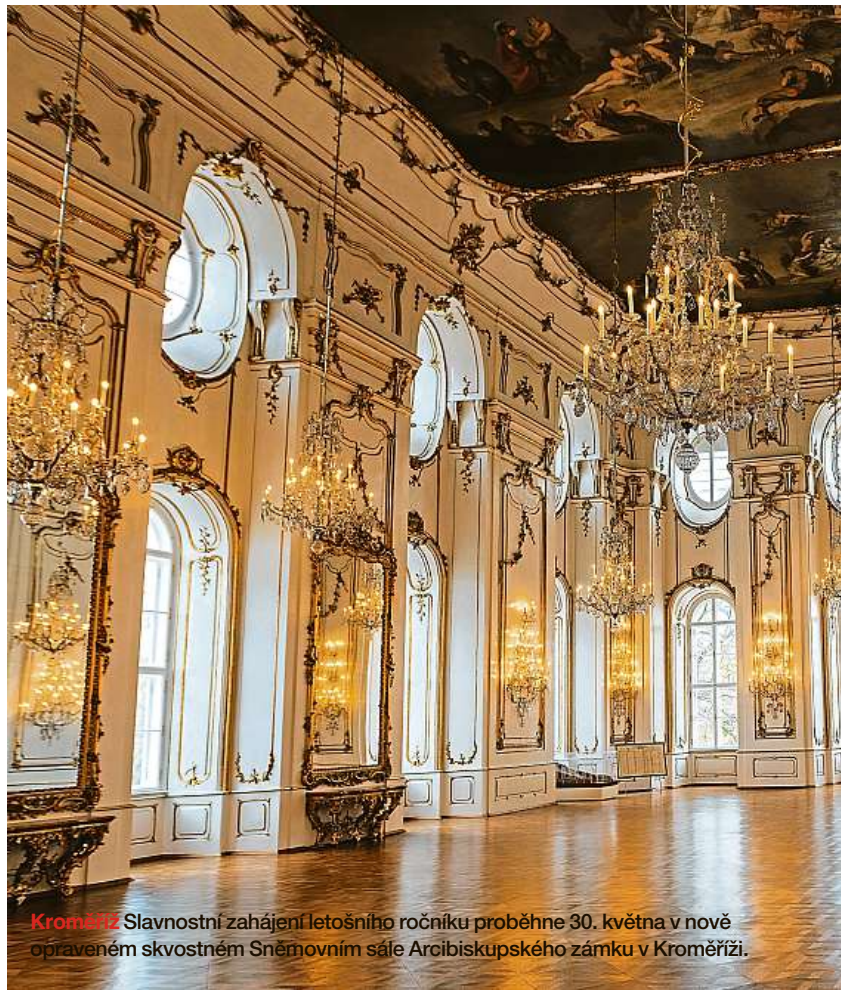
Kroměříž Slavnostní zahájení letošního ročníku proběhne 30. května v nově opraveném skvostném Sněmovním sále Arcibiskupského zámku v Kroměříži.