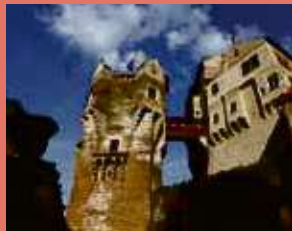
Státní hrad Pernštejn