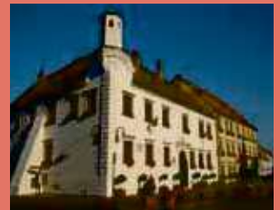
Slavkov u Brna